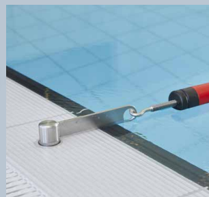
Douilles de sol

Solutions universelles pour tous types de bassin Aide à la planification comprise