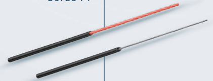
Corde CNC (conforme aux directives FINA)