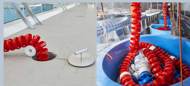
Passage de dalle avec réservoir de collecte